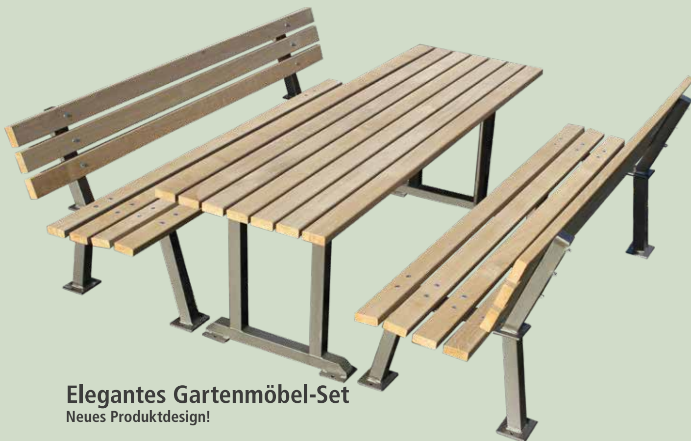
Elegantes Gartenmöbel-Set Neues Produktdesign!